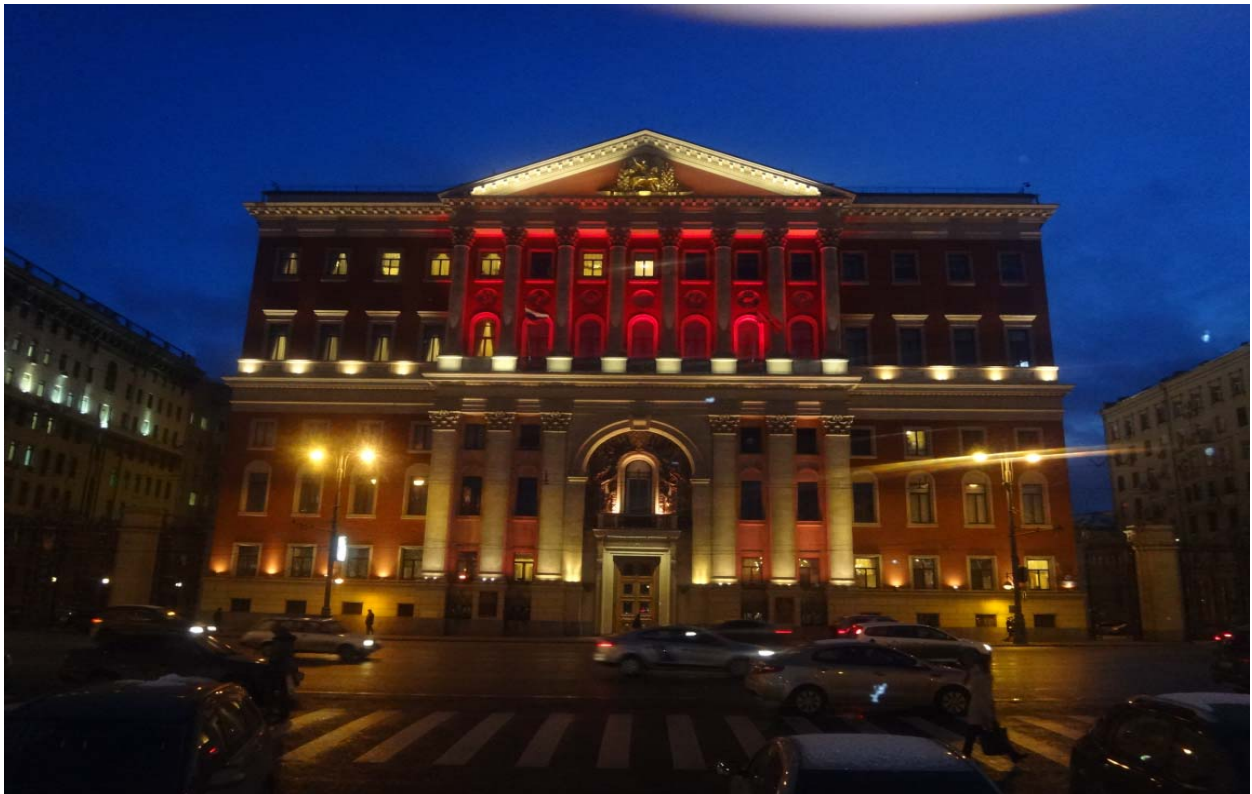
Рис.5 Подсветка фасадов дома 13 по Тверской улице (мэрия города Москвы)