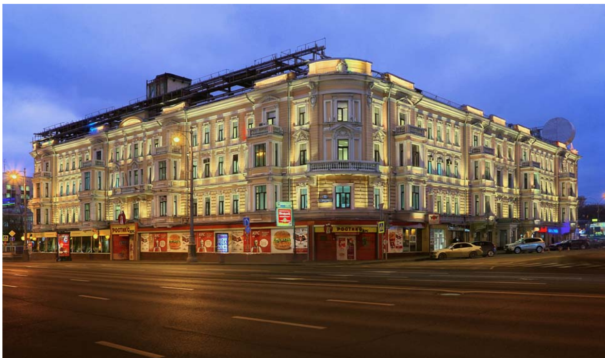
Рис.1 Подсветка фасадов дома 2с1 по 1-й Тверской-Ямской ул