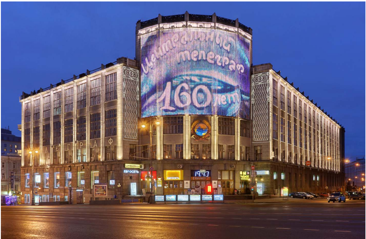
Рис.6 Подсветка фасадов дома 7 по Тверской улице (центральный телеграф)

Описание: Описание и фотографии выполненных работ по архитектурно-художественному освещению зданий